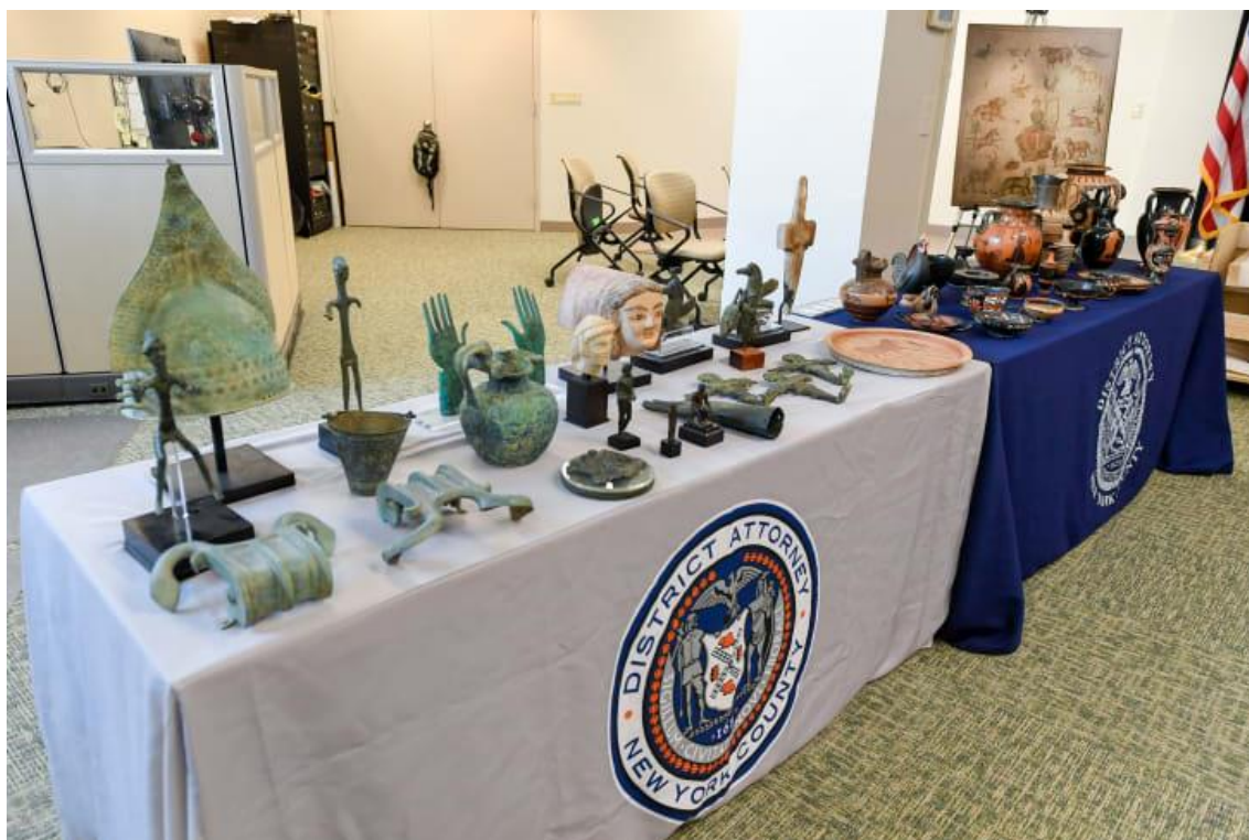
Φωτο Γ, επαναπατρισθέντα αντικείμενα της υπόθεσης Steinhardt στην Ιταλία. Διακρίνεται το ειδώλιο Σαρδηνίας