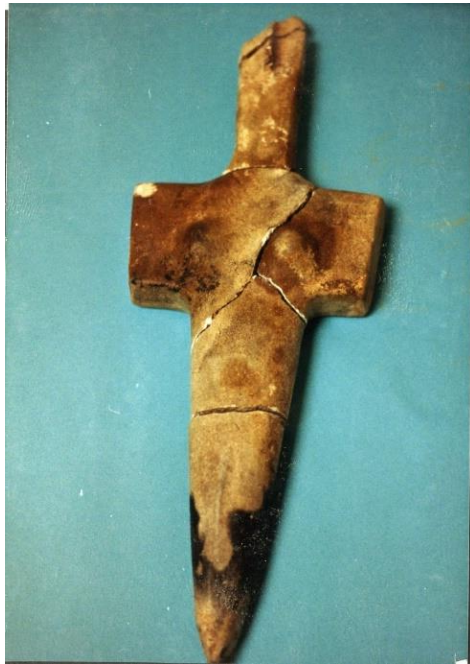
Φωτο Α 3

των Christie's 1 . Στη φωτο Γ φαίνεται το ειδώλιο κατά την τελετή επαναπατρισμού, μεταξύ των αντικειμένων που κατασχέθηκαν. 2