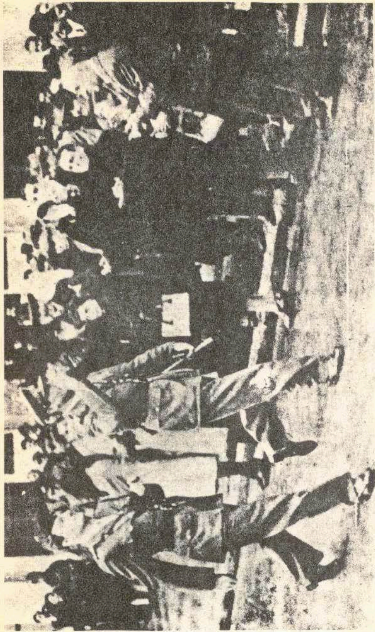
Ο Σκόμπι κιτλοφορεί στους άθηνάϊκους δρόμους: Άραιά χειροκροτήματα.